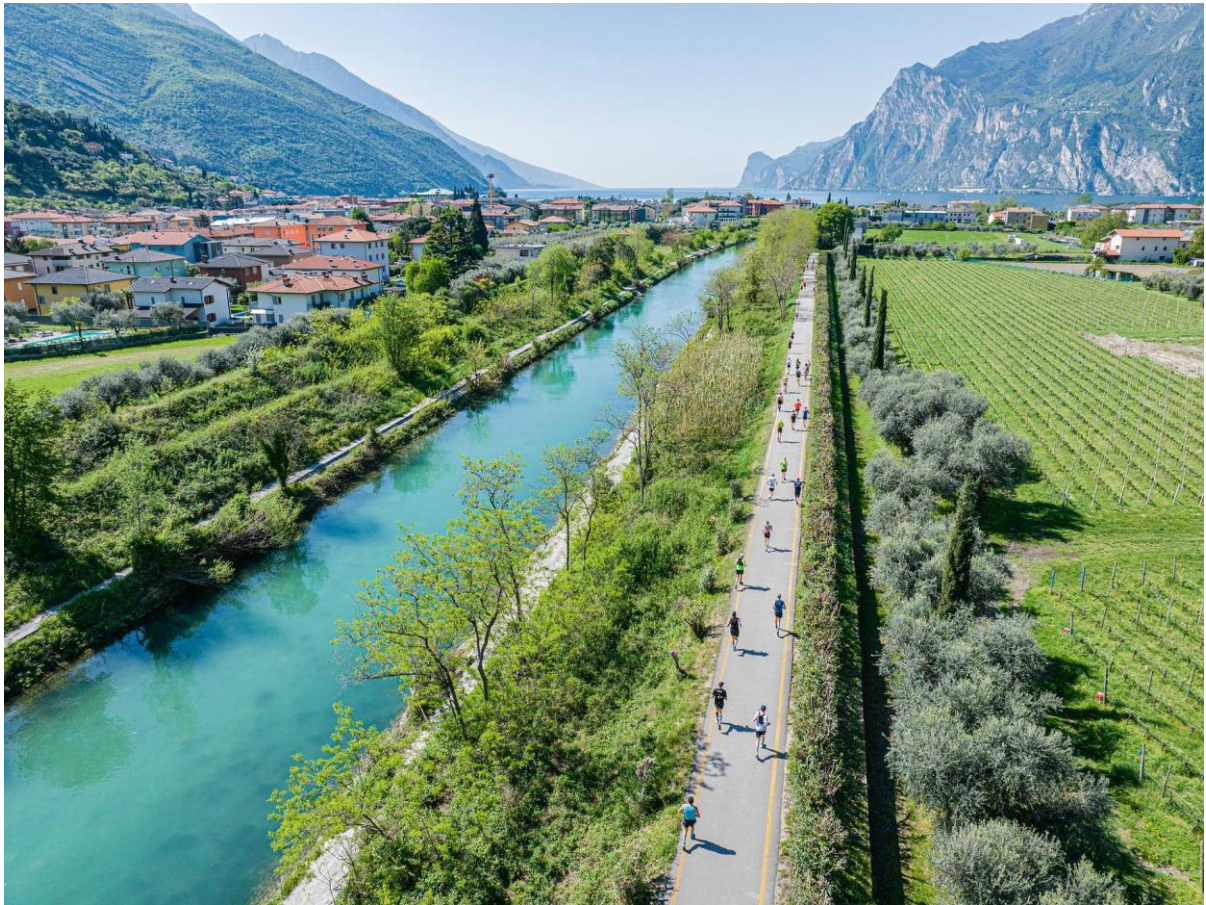
LAKE GARDA 42

presenza nella passata edizione, ci aspettiamo un viaggio stimolante e siamo entusiasti di contribuire a rendere l'evento del 2025 il più memorabile di sempre».