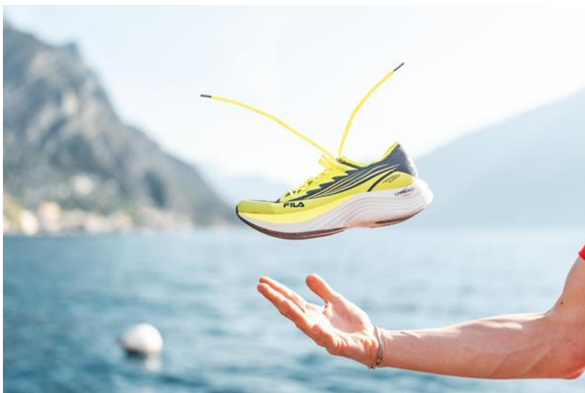
LAKE GARDA 42

L'evento running che negli ultimi anni ha radunato sul Lago di Garda migliaia di appassionati di corsa ritorna nel 2025 con importanti novità, a partire dal nuovo title sponsor FILA, lo storico brand che ha contribuito per anni a diffondere l'immagine del design italiano anche nell'abbigliamento e nelle attrezzature sportive. La manifestazione dalla prossima edizione si chiamerà FILA LAKE GARDA 42 e proporrà le tradizionali maratona LG42 e mezza maratona LG21, che si correranno domenica 6 aprile. Sul solco delle passate edizioni, l'intero weekend sarà contraddistinto da un'agenda di eventi collaterali che per tre giorni trasformeranno la sponda settentrionale del Lago di Garda nella location di un vero e proprio running festival. Rimangono invariati anche i percorsi delle due gare protagoniste: partenza da Limone sul Garda, passaggio per Arco e Riva del Garda nel Garda Trentino e arrivo a Malcesine per la maratona LG42, e allo stesso modo sono confermate Arco di Trento e Malcesine come sede rispettivamente del via e del traguardo della mezza maratona LG21.